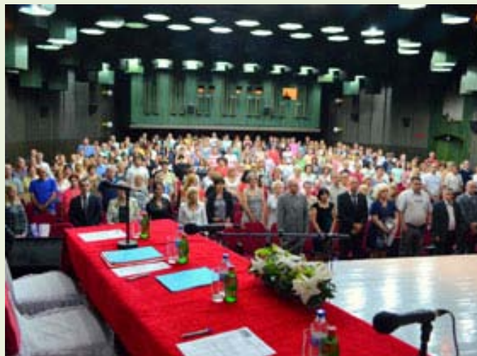
право синдикално деловање.

Такође је у оквиру своје унутар синдикалне социјалне политике почела са поделом повратне и бесповратне материјалне помоћи и с тим у вези и оформила Комисију за социјална давања, како би се сва средства вратила чланству и тиме показало